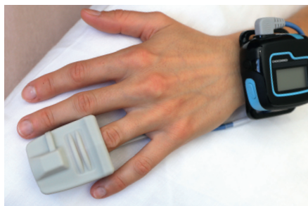
Sensor de SpO 2 , conectado durante la noche

Gracias al registro de respiraciones derivadas del ECC, el Holter medilog®AR puede detectar posibles episodios respiratorios durante el sueño. El sensor opcional de SpO 2 , conectado por Bluetooth, permite registrar información respiratoria adicional.